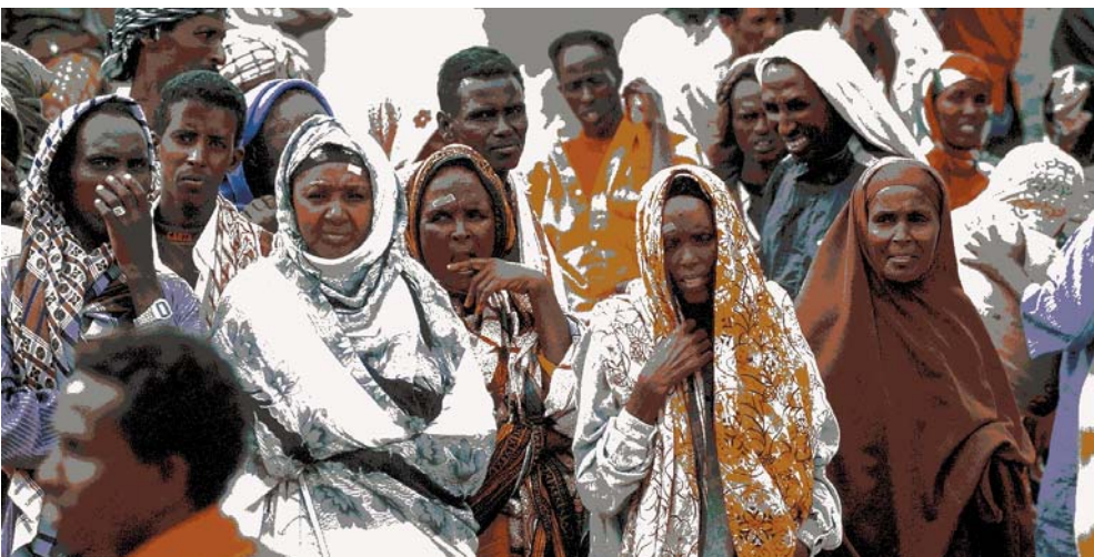
Eindrücke aus Somalia