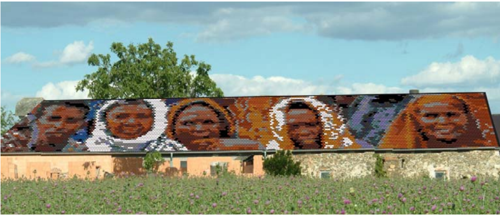
Motiv „Menschen aus Somalia“ – Engelsdorf